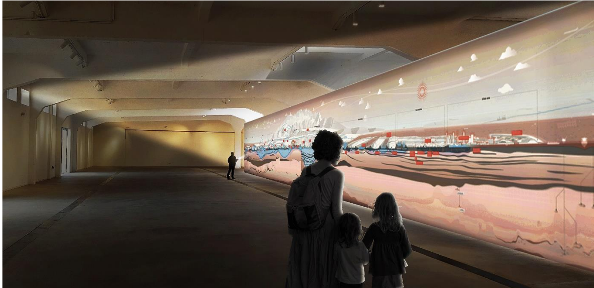
Artist impression van de animatie van Atelier Droogte in de Delta © IABR, Studio Marco Vermeulen

19 SEPTEMBER – 18 OKTOBER | KEILEZAAL ROTTERDAM 11.00 – 17.00 UUR, MAANDAG GESLOTEN